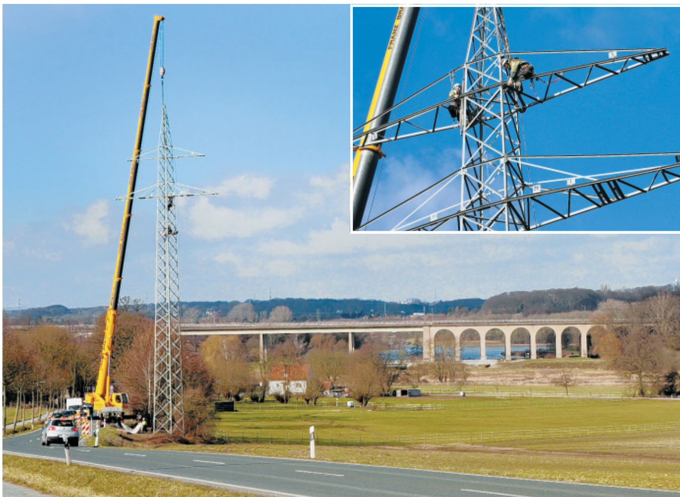
In schwindelnder Höhe: Arbeiter befestigen die Trageile am Strommast. Mit einem Kran wird das 30 Meter hohe Stahlskelett, das direkt neben der Talbrückenstraße steht, herabgelassen. Im Hintergrund sind der Viadukt und der Obersee zu sehen.

■ Jöllenbeck . Der Ausbau der Engerschen Straße sowie die Abbindung des Südfelds sind zwei von mehreren Themen, die in der Bezirksvertretung Jöllenbeck am Donnerstag, 10. Februar, behandelt werden. Beginn der Sitzung ist um 17 Uhr in der Aula der Realschule.