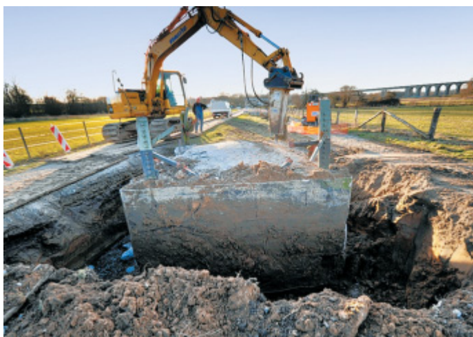
Das Fundament: Der Mast in der Johannesbachau ist abgebaut. Der Untergrund wird für den neuen vorbereitet.

Weil Amprion darüber hinaus auch die Leistung seiner Leitung auf 380 Kilovolt erhöhen will, steht das Projekt vor Ort teils in der Kritik. Ein Anwohner klagte bereits vor dem Bundesverwaltungsgericht. Die Planung läuft aber weiter.